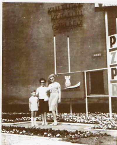
Czeladź – Piaski (obecnie ul. Trznadla)