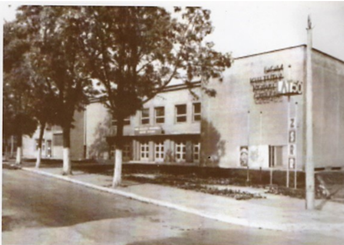
Czeladź – Piaski (obecnie ul. Trznadla)